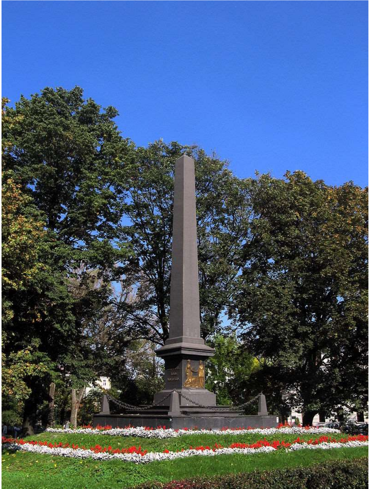
Pomnik Unii Lubelskiej w Lublinie z 1826 roku

We wcześniejszych wiekach związek między Polakami a Litwinami polegał raczej na luźnym układzie unii personalnej, czyli połączenia narodów przez osobę jednego władcy. Początkowo do zawarcia unii dążyli głównie Polacy, jednak i Litwini w końcu dojrzeli korzyści, jakie mogą z tego dla nich wynikać.