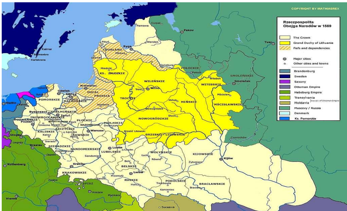
Rzeczpospolita po unii lubelskiej w 1569 r.